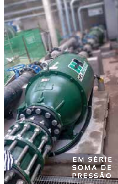
EM SÉRIE SOMA DE PRESSÃO