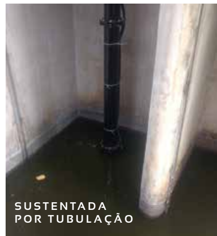
SUSTENTADA POR TUBULAÇÃO